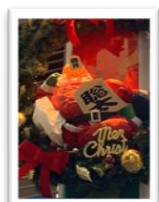
3番街 浅野屋前 「藤井聡太サンタ」