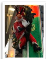
1番街 三井住友銀行角 「トナカイサンタ」