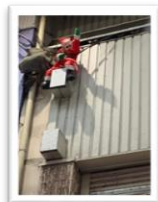
3番街 auショップ上 「白顔サンタ」