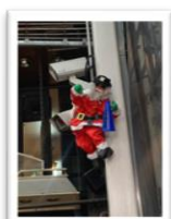
2番街 サハラ前 「阪神優勝サンタ」